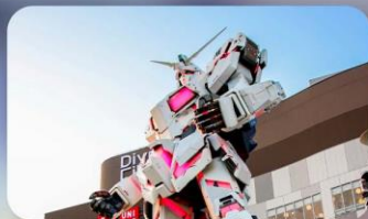
ช้อปปิ้งโอไดบะ