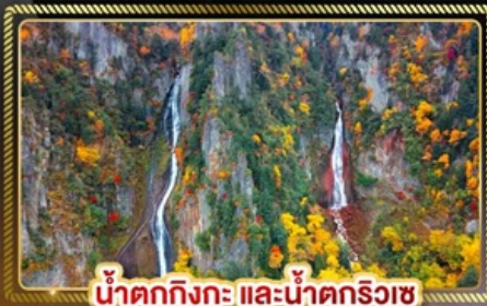
น้ำตกทิงกะ และน้ำตกริวเซ