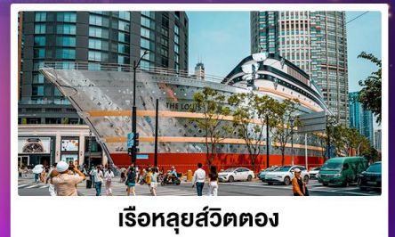
เรือหลุยส์วิตตอง