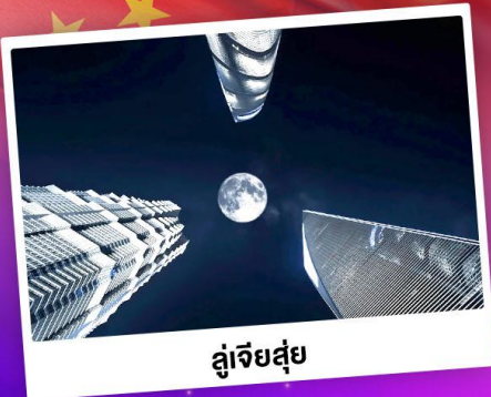
ลู่เจียซู่