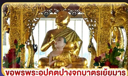
ขอพรพระอุปคุตปางจากบาตรเขี้ยว