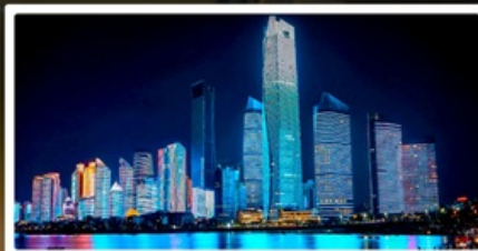
หาดไซเบอร์ฟังก์