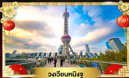
วงเวียนหมีงู