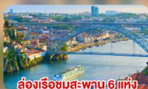
ส่องเรือชมสะพาน 6 แห่ง ในคูเมืองปอร์โต