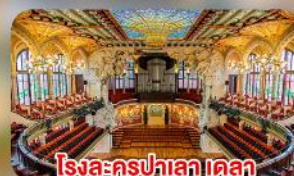
โรงละครปาลาเล เดล มูสิคก้า คาตาลาน