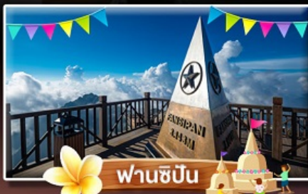
ฟานชิปัน