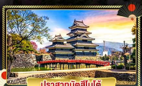
ปราสาทมัตสึโมโต้