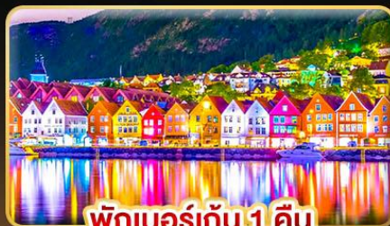
พักเบอ์เกิน 1 คืน