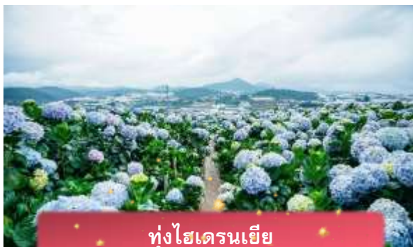
ทุ่งไฮเดรนเยีย

นำท่านเล่น นั่งโรลเลอร์โคสเตอร์ ชมธรรมชาติท่ามกลางป่าสนไปยัง น้ำตกตาดันลา สัมผัสอากาศบริสุทธิ์และบรรยากาศสดชื่น พร้อมจิบเครื่องดื่มชม วิวธรรมชาติ นำท่านเดินทางสู่ ทุ่งไฮเดรนเยีย อีกหนึ่งทุ่งดอกไม้ ที่ไม่ควรพลาดมาถ่ายรูปกัน ข้อดีของที่นี่ คือ ดอกไม้จะบานตลอดทั้งปี