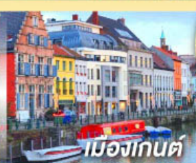
เมืองกันต์