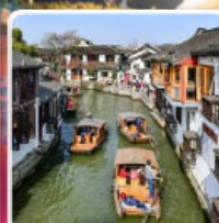
หมู่บ้านโบราณจูเจียวเจียว