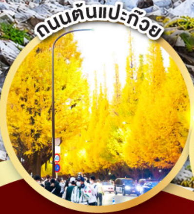
ถนนต้นไม้เปลี่ยนสี