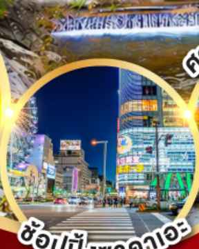
ช้อปปิ้งซาคาเอะ