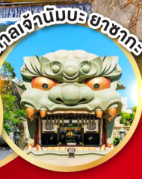
ศาลเจ้านิมบะฮะซากะ