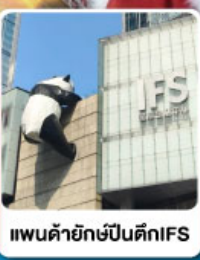
แพนด้ายักษ์ปีนตึกIFS