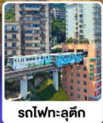
รถไฟฟ้าชตุติค