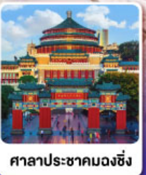
ศาลาประชาคมฉงชิ่ง