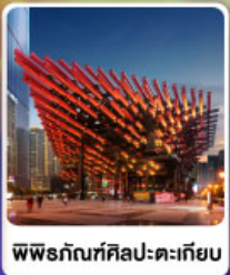
พิพิธภัณฑ์ศิลปะตะเกียบ