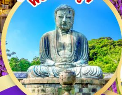
หลวงพ่อโต ไคบุคสึ