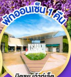
มิตซูเอะอิเกะอิเล็ค พาร์ค คิชะระชู