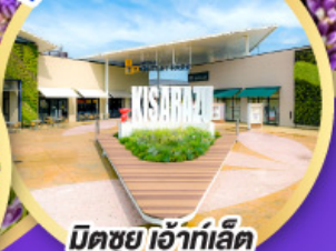
มิตซูเออิท์ เล็ค พาร์ค คิชะระชู