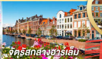
จัตุรัสกลางฮาร์เล็ม