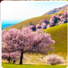
ทุ่งดอกอัลมอนด์