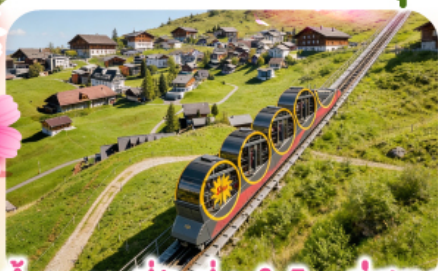
ขั้รรางที่ชันที่สุดในโลกสู่สตูล

พิชิตยอดเขาชุนเนกกา 1 ในเขาที่สวยงามที่สุดเมืองเซอร์แมท