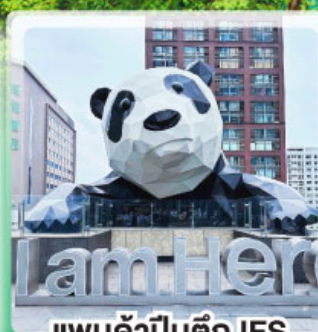
แพนด้าปิงตึก IFS