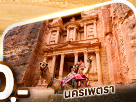
นคริพตรา