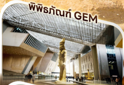
พิพิธภัณฑ์ GEM