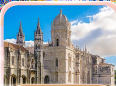
มหาวิหารเซโร นีโม