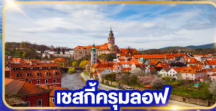
เซสท์ক্রุมลอฟ