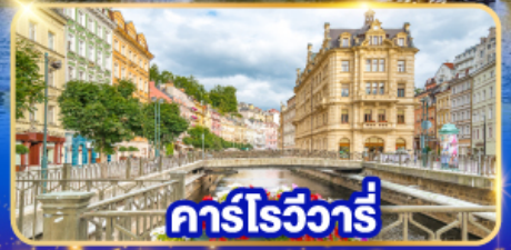
คาร์โรวาร์