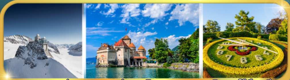
ยอดเขาจุงเฟรา ปราสาทซิลยง นาฬิกาดอกไม้เมืองเจนีวา

กระเช้าไอเกอร์ : ยอดเขาจุงเฟรา | กระเช้า : ยอดเขาโคลน์แมทเทอร์ฮอร์น กับ ดินแดนห้าหมู่บ้านสวิสแควแคร์ส