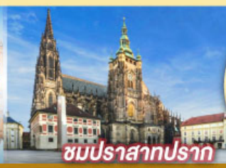
ชมปราสาทปราก