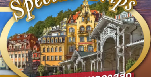
ชมสถาปัตยกรรมคลาสสิก เมือง คาร์โลวี วารี