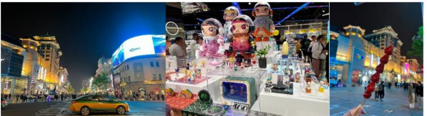
ที่พัก Beijing Henan Plaza Hotel หรือเทียบเท่าระดับ 4 ดาว (มาตรฐานจีน)