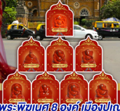
พระพิฆเนศ 8 องค์ เมืองปูเน่