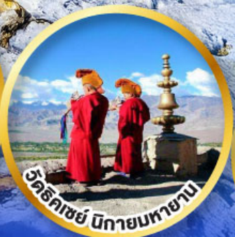
วัดริคเซย์ นิกายมหายาน