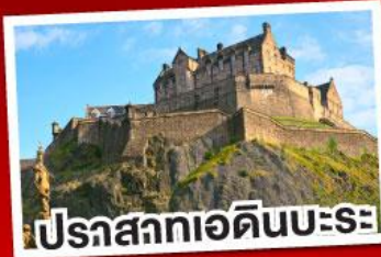
ปราสาทเอдинบะระ