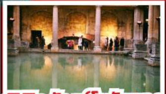
เยือนสโตนเฮ้นจ์ และ พิพิธภัณฑิไรมันบาร