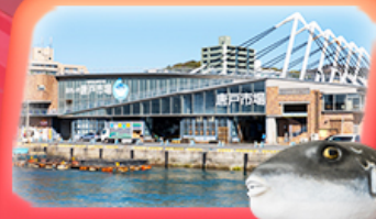
KARATO FISH MARKET