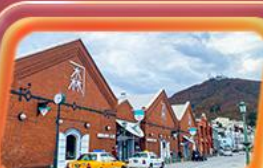
โถงอิฐแดง

✈️ สายการบิน Thai Airways (TG) น้ำหนักกระเป๋า 23 KG