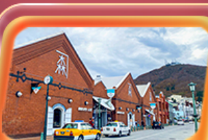
โถงอิฐแดง

สายการบิน Thai Airways (TG) น้ำหนักกระเป๋า 23 KG