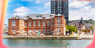
โมจิโกะ เร็รโธ

สายการบิน Vietjet Air (VZ) น้ำหนักกระเป๋า 20 KG