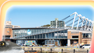
ตลาดปลาคาราโตะ