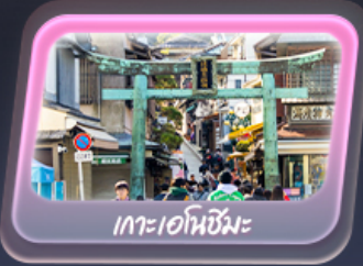
เกาะเอนชิมะ