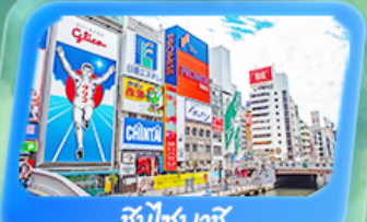
ชินไซบาชิ