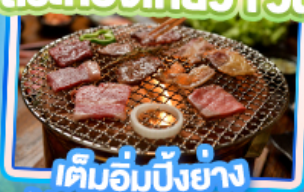
เต็มอิ่มปิ้งย่าง Yakiniku Buffet