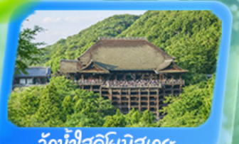
วัดน้ำใสคิโยมิกุเดระ