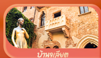
บ้านจูเลียต