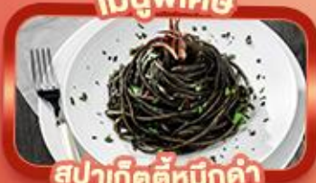
สปาเก็ตตี้หมักดำ