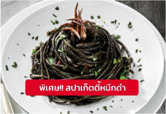
พิเศษ!! สปาเก็ตตี้หมีกดดำ

Highlight! เมื่อเยือนเกาะเวนิส เมนูที่ขึ้นชื่อและหากได้มาต้องได้ลิ้มลอง สปาเก็ตตี้หมีกดดำที่คลุกเคล้ากับความหอมนุ่มนวลกับบรรยากาศ