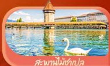
สะพานไม้ซังปก

Highlight เยือนหมู่บ้านแสนสวยเซอร์แมท เช็กอินศาลาไทยสุดงามที่โลซาน เที่ยวลูเซิร์น ชมสะพานไม้ซังเปเลและอนุสาวรีย์สิงโต ซาลี แอปลิน ชมประติมากรรม The Fork และปราสาทซิลลองริมทะเลสาบ เยือนมิลาน มหาวิหารดูโอโม ที่เวนิส เมืองลอยน้ำสุดโรแมนติก อินกับรักอมตะที่บ้านจูเลียต และช้อปปิ้งจุใจที่ Serravalle Outlet