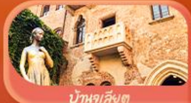
บ้านกุสเซียต