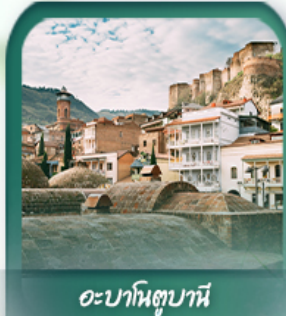
อะบาโนตูปานี