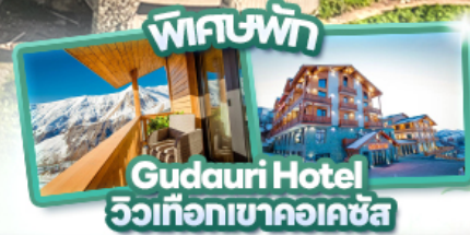
พักรีสอร์ท Gudauri Hotel วิวเทือกเขาคอเคซัส