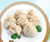
เกี้ยวจอร์เจีย Khinkali