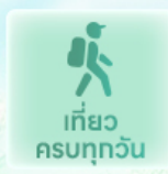
เที่ยว ครบทุกวัน