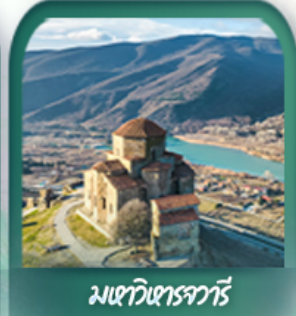
มเตวีซารจาวรี