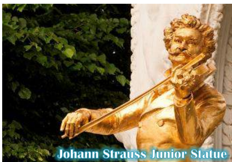
Johann Strauss Junior Statue

เช้า บริการอาหารเช้า ณ ห้องอาหารของโรงแรม นำท่านออกเดินทางเข้าสู่ใจกลาง “กรุง เวียนนา” (Vienna) ผ่าน “ถนนวงแหวน” Ring Strasse ซึ่งเป็นที่ตั้งของ โรง อوبرาการ (โอเปราเฮาส์), พระราชวังฮอฟบวร์ก, อาคาร รัฐสภา, ศาลาว่าการ, มหาวิทยาลัยเวียนนา, โบสถ์ประจำเมือง, ศาลสูง ฯลฯ เดินทางสู่ “สวนสาธารณะสตัดต์ปาร์ค” สวนสาธารณะอัน ร่มรื่นใจกลางเมือง ชม “ อนุสาวรีย์ โยฮัน สเต ราส์ จูเนียร์ ” Johann Strauss ศิลปินที่มี ชื่อเสียงก้องโลก