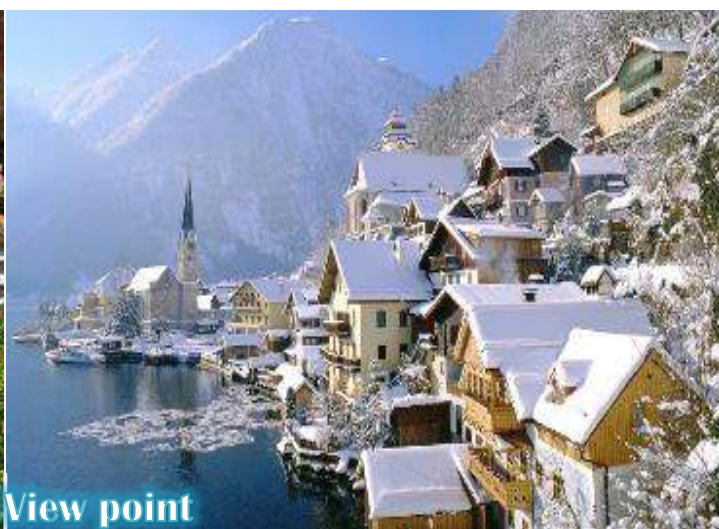
Hallstatt View point