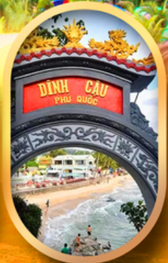
ศาลเจ้าดิงเกา