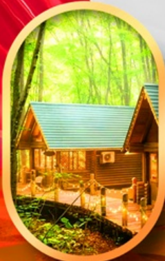
นิงเกิ้ลทอรัส