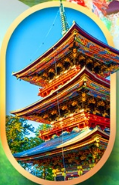
วัดนาริตะ-ซัง