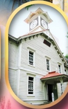
ผ่านชมหอนาฬิกา