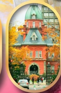
ศาลาว่าการเก่า