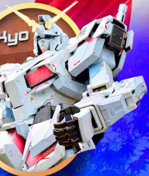
ห้างไอโดปะกับดัม