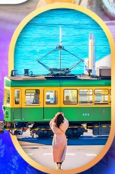
ถนนโคมาจิโดริ

✔️ ฟรี สวมใส่ ชุดยูคาตะ ถ่ายรูปเช็คอินสวยๆ