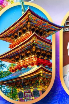
วัดนาริตะ-จิน