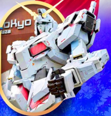
ห้างไอโดะบะกันดั้ม