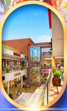
มิตซุชิเอะกัอิเล็ท