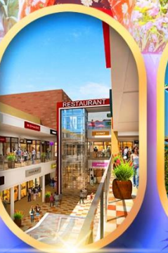
มิตซูยะเอจิกะเออิ