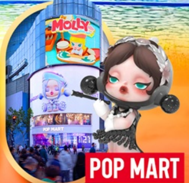
ถนนหนานจิง POP MART