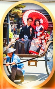
เมืองเก่าทาคายามา