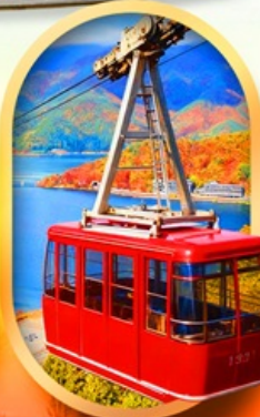
ขึ้นกระเช้าทะเลสาบมิกะตะ