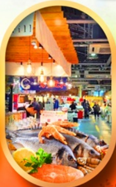
ตลาดปลานิวโตะ