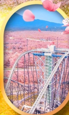
ฟูจิยาม่า ทาวเวอร์