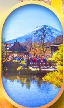
หมู่บ้านน้ำใส