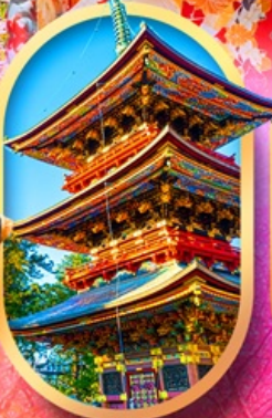
วัดนาริตะ-ซัน