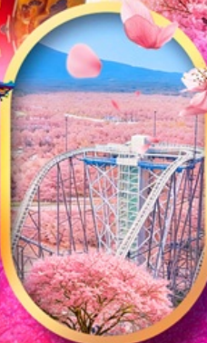
ฟูจิยาม่า ทาวเวอร์