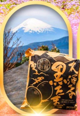
หุบเขาไอวาคุดาบิ