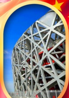
ผ่านชมสนามกีฬาฟาริงก