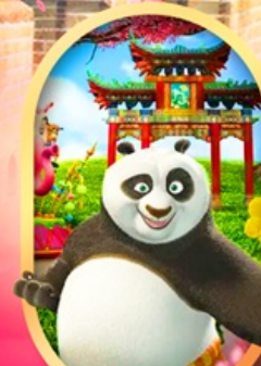
OPTION Universal Studios