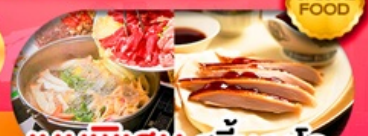
เมนูพิเศษ สุกัมองโก อาหารกวางตุ้ง + เปิดปักกิ่ง เดินทาง มี.ค. - ต.ค. 69