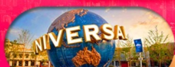
อิสระฟรีเดย์ 1 วัน หรือเลือกซื้อทัวร์เสริม US