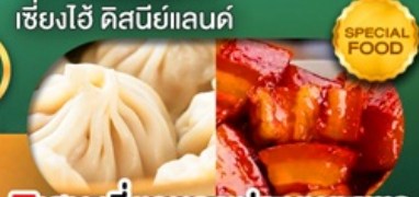
พิเศษ เสี่ยวหลงเปา หมูตงฟอ เดินทาง ม.ค. - มิ.ย. 69