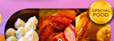
พิเศษเมนูเสี่ยวหลงเปา หมูตงพ้อ ไก่จอกาน เดินทาง ม.ค. - มี.ย. 69